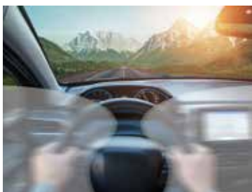
Sehbereiche noch größer